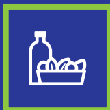
Lunch med dryck