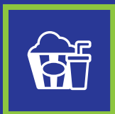
Popcorn och cola på bio